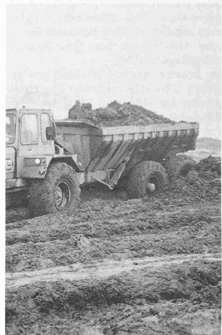
Bild 1. Auffüllarbeiten bei nassem Wetter

Durch die Untersuchungen sollen die Möglichkeiten und Grenzen der Tieflockerung bei der Sanierung von verdichteten Böden abgeklärt werden. Unter der Tieflockerung versteht man das Auflockern einer mindestens 40 bis 60