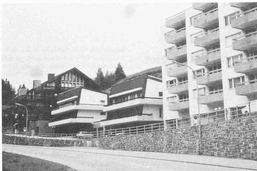
Bild 2. Das Erscheinungsbild von Gemeinden, die sich wirtschaftlich stark entwickelt haben, ist oft stark gestört. Lenzerheide