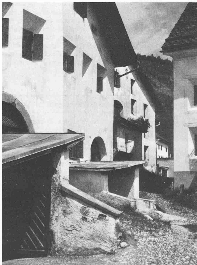
Bild 7. Aus handwerklichen und gesellschaftlichen Schranken sind eindruckliche Dorfbilder entstanden. La Punt im Engadin

Dazu kommt, dass das Unschöne unserer neuen Siedlungen und Quartiere nicht primär im architektonischen Detail liegt, sondern in der Art und Weise, wie die Bauten dieser Neubauquartiere und Dorfzentren angeordnet sind. Es ist also nicht allein eine Frage der richtigen oder falschen Gestaltung der Fassaden, sondern ein Problem der Zuord-