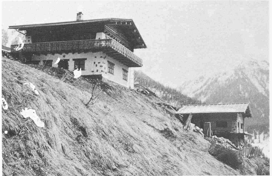
Bild 11. Die einzigen Bezugspunkte dieser Häuser: Aussicht und Sonne

dieser Häuser sind die Aussicht und die Sonne. Aussicht ist zum teuer bezahlten Gut, zum Statussymbol geworden, dem die ganze Architektur, der ganze sogenannte «Städtebau» untergeordnet wird – ein Phänomen, das erst seit fünfzig Jahren zu beobachten ist. Wenn man von diesem Aussichtsfetischismus ausgeht, ist es schwieriger, eine gute Siedlung zu gestalten, denn die gute Siedlung beruht an sich auf der Beziehung des einzelnen zur Gemeinschaft (Bilder 10 und 11).