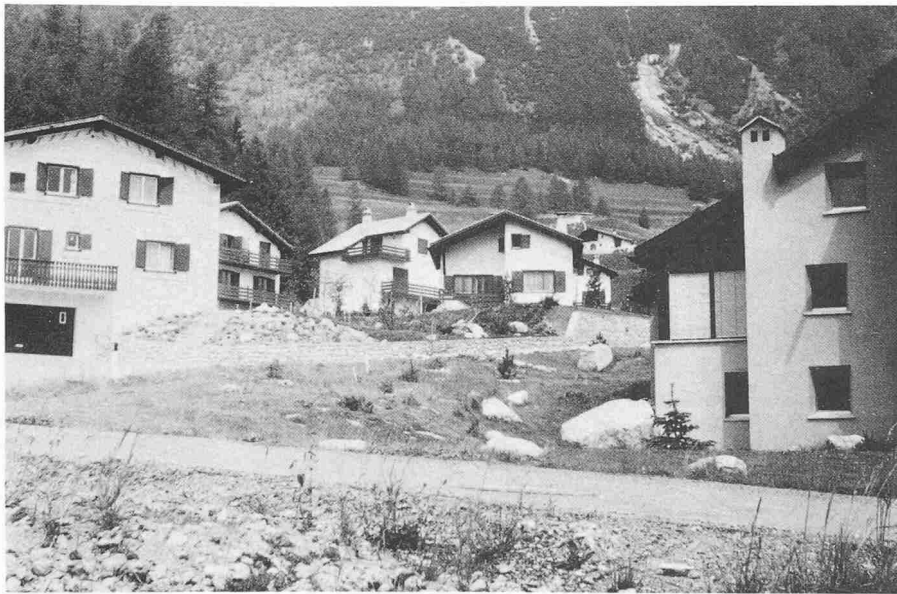
Bild 8. Dorftränder und Ferienhaushänge als Musterkarten aller Stile und Vorstellungen. La Punt – Chamuesch

Wenn man die alten Dorfstrukturen, die Typologie untersucht, stösst man bald darauf, dass die Grundlage der städtebaulichen Anordnung auf menschlichen, soziologischen Beziehungen der einzelnen Dorfmitglieder zueinander beruhen. Es sind z. B. die Zugehörigkeit und damit die Bezugnahme einer Häusergruppe zu einem Brunnen und seinem Platz, die Ausrichtung der Bürgerhäuser auf eine Hauptstrasse oder die Konzentration der Häuser auf eine Hangkante, um möglichst die fruchtbaren Bodenflächen für die Felder freizuhalten. Die heutigen Ferienhauswiesen haben keine zwischenmenschlichen Beziehungen als Grundlage, denn es ist ja eine zufällige Gruppierung von Individualisten ohne Kontaktbedürfnis. Der einzige Bezugspunkt