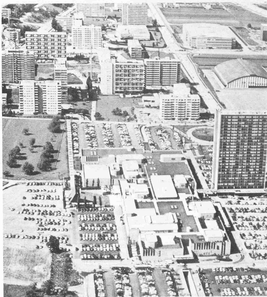
Jede Gegend hat zwei Gesichter; das eine zeigt man auf der Postkarte, das zweite ist, wie man sagt, wirtschaftlich bedingt. Flugaufnahme von Spreitenbach ZH

Daraus könnte man nun den Schluss ziehen, dass eine wirtschaftliche Entwicklung zwangsläufig mit der Zerstörung des Dorfbildes, mit der Hässlichkeit der Siedlung erkaufte werden muss, so wie Dr. Faustus seine Seele an Mephisto gegen Erfolg und Geld verkauft. Oder man könnte den andern Schluss ziehen, dass alte Häuser und Dörfer stets schön, neue hingegen immer hässlich sein müssen.