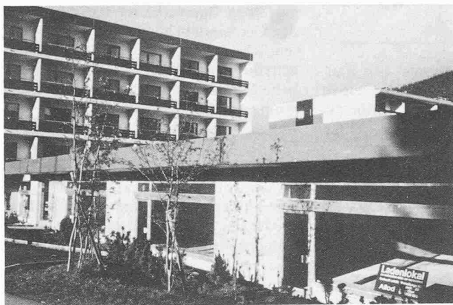
Bild 5. Neue Bauaufgaben wurden in das Berggebiet hineingetragen, deren Lösungen sich nicht aus der Bautradition ableiten liessen. Lenzerheide