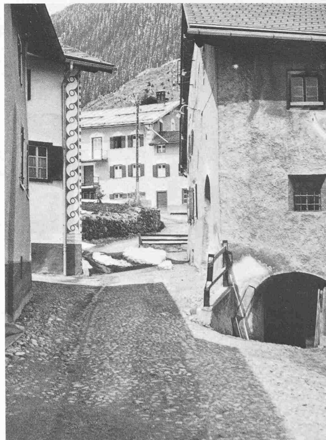
Bild 9. Gute Siedlungsbilder sind wesentlich bestimmt von der An- und Zuordnung der Bauten. Latsch