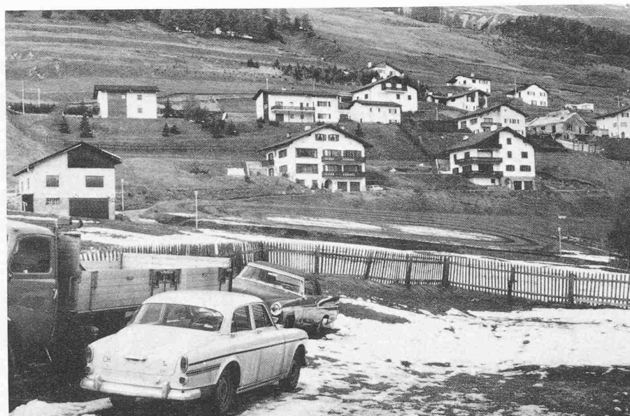
Bild 3. Überbauung am Dorfrand von Zuoz