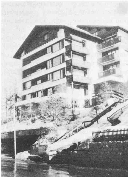
Bild 10. Aussicht ist zum Statussymbol geworden. St. Moritz