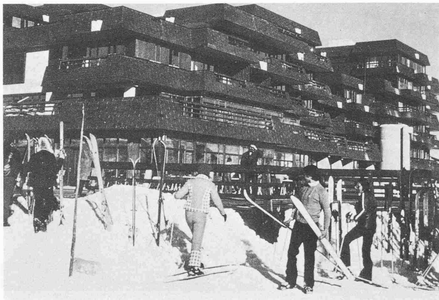
Bild 13. Touristische Neuanlage. Thyon 2000

kleineren Siedlungen, möglicherweise auch in Maiensässen, wo der Tourismus nur als unwesentlicher, zusätzlicher Erwerb besteht (Bild 12).