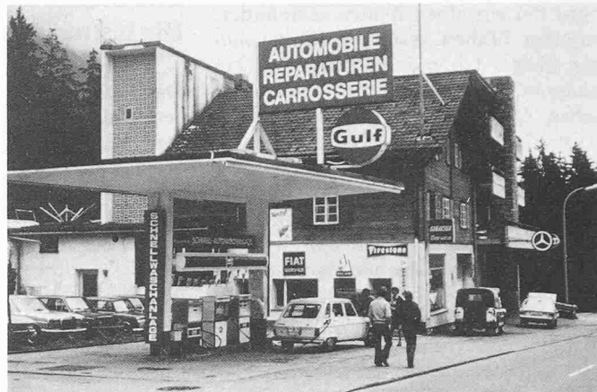
Bild 6. Die Umstellung in der Lebensweise brachte alle Segnungen des modernen Komforts

hoffen, dass die Eigentumswohnblöcke von St. Moritz, Lenzerheide, Disentis und Flims in fünfzig Jahren im Kunstdenkmälerverzeichnis von Graubünden aufgeführt werden.