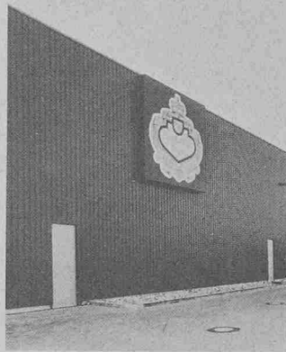
Thyssen-Thermowand. Typ VT 66 ( k = 0,559 W/m 2 K)

Die Wärmeleitfähigkeit des diffusionsdicht eingeschlossenen Pur-Hartschaumes beträgt 0,029 W/mK (0,025 kcal) und ergibt dabei Wärmedurchgangszahlen von k = 0,795 W/mK (0,684 kcal) bei 37 mm Wandstärke bis zu k = 0,161 W/mK (0,138 kcal) bei 180 mm Dicke. Dichte Elementstöße und der