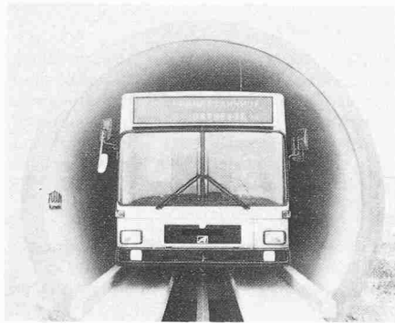
Probefahrt eines elektronisch spurgeführten Busses durch einen extra dafür entworfenen Tunnel, der sich durch minimalen Raumbedarf und geringe Baukosten auszeichnet

Der Tunnel, der aus einzelnen Segmenten besteht, kann schnell, kostengünstig und mit minimaler Behinderung für den Oberflächenverkehr gebaut werden.