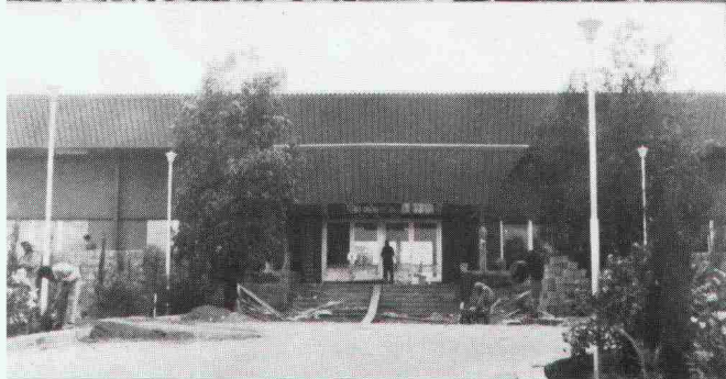
Empfangshalle Khamis Mushayt, Empfangshalle Tabuk, Saudi-Arabien

Generalunternehmung: Losinger AG, Bern/Jeddah Eigentümer: Ministry of Defense, Saudi-Arabien