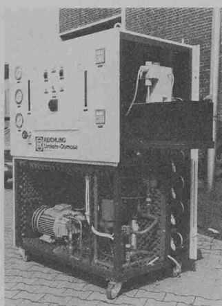
mose-Schrankgerät entwickelt. In der Normalausführung erzeugt es stündlich je nach Mo-

delbestückung 0,3 bis 0,8 m 3 Reinwasser. Mit Spezialausrüstung lässt sich die Kapazität auf 1,2 m 3 /h erhöhen. Das Rohwasser kann einen Salzgehalt von 2000 mg/l haben. Der Restsalzgehalt nach der Behandlung beträgt maximal 10 Prozent. Das eingespeiste Wasser wird im Gerät von einem Druckminderer auf konstanten Vordruck eingestellt und über ein 25 µm-Feinfilter geleitet, um das Wasser von mechanischen Verunreinigungen zu befreien. Durch dosierte Zugabe von verdünnter Schwefelsäure wird der pH-Wert auf etwa 5 eingestellt, um die Osmose-Membran zu schonen. Eine gleichzeitige Zugabe an Spezialphosphat verhindert das Ausfällen von Härtebildnern und das Verstopfen der feinen Membranporen. Zwei hintereinandergeschaltete Pumpen erhöhen den zum Entsalzen im Rohwasser erforderlichen Druck auf 28 bar und drücken es damit durch die Module. Hierbei teilt sich das Rohwasser in Reinwasser (Permeat) und Konzentrat, das die gesamten Salze enthält. Während das Reinwasser in einen Vorratsbehälter fliesst, leitet man das Konzentrat zur Kanalisation ab. Messgeräte zeigen ständig den pH-Wert und die Reinwasserqualität, den Rohwasservordruck, den Arbeitsdruck der Anlage, den Verschmutzungsgrad des Feinfilters und die Menge an Reinwasser und Konzentrat an. Eine elektrische Steuerung regelt den Funktionsablauf und überwacht die Anlage.