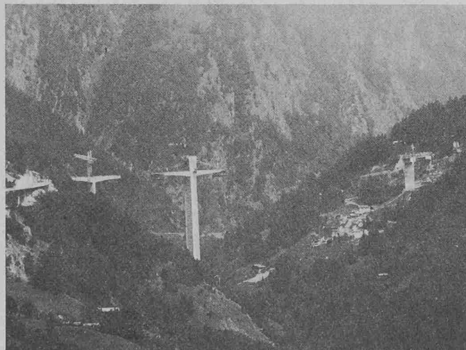
Auf einer Länge von 678 m wird die Ganterbrücke das Gantertal überqueren. In der Bildmitte der mit 148 m höchste Pfeiler 3. Noch nicht sichtbar ist rechts davon Pfeiler 4, der in den geologisch heiklen, linksufrigen Kriechhang zu sehen kommt und deshalb auf einem ca. 40 m tiefen Schacht fundiert wird

Turm des Wolffkrans mit dem kraneigenen, anbaubaren Kletterwerk freistehend bis 46,5 m Hakenhöhe verlängert. Auf 34,95 m Höhe brachte man die erste Kranverankerung am Pfeiler an, wobei die Ankerplat-