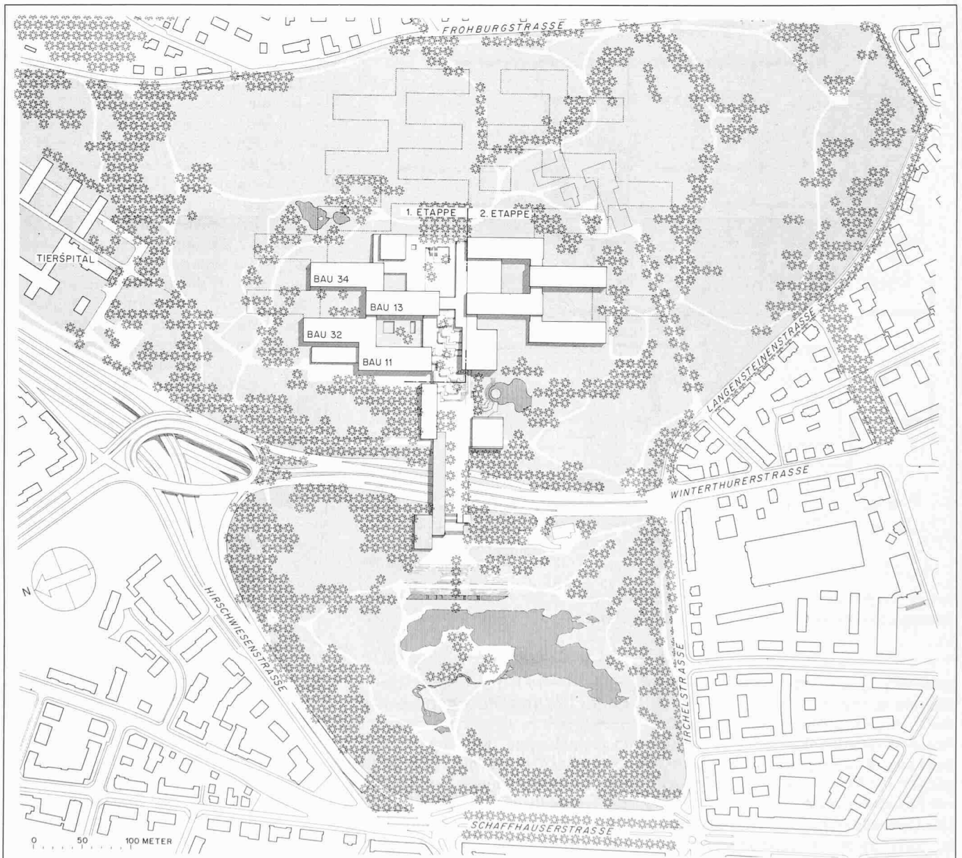
Lageplan der Gesamtanlage. Die Erweiterungsmöglichkeiten sind angedeutet. Die weiträumige Parkanlage dient nicht nur der Hochschule. Sie bildet auch ein attraktives Naherholungsgebiet für das Quartier