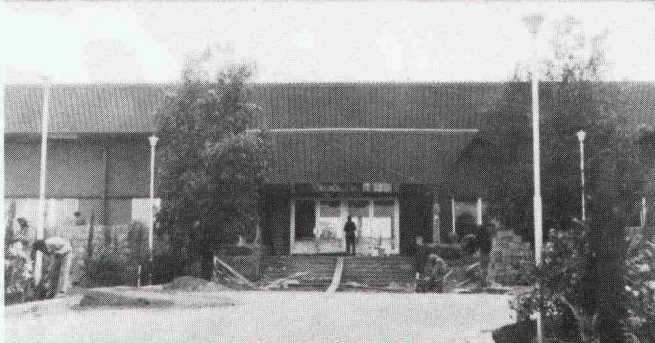
Empfangshalle Khamis Mushayt, Empfangshalle Tabuk, Saudi-Arabien

Generalunternehmung: Losinger AG, Bern/Jeddah Eigentümer: Ministry of Defense, Saudi-Arabien