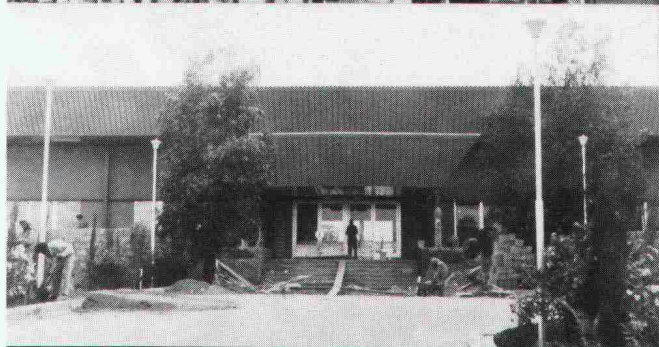
Empfangshalle Khamis Mushayt, Empfangshalle Tabuk, Saudi-Arabien

Generalunternehmung: Losinger AG, Bern/Jeddah Eigentümer: Ministry of Defense, Saudi-Arabien