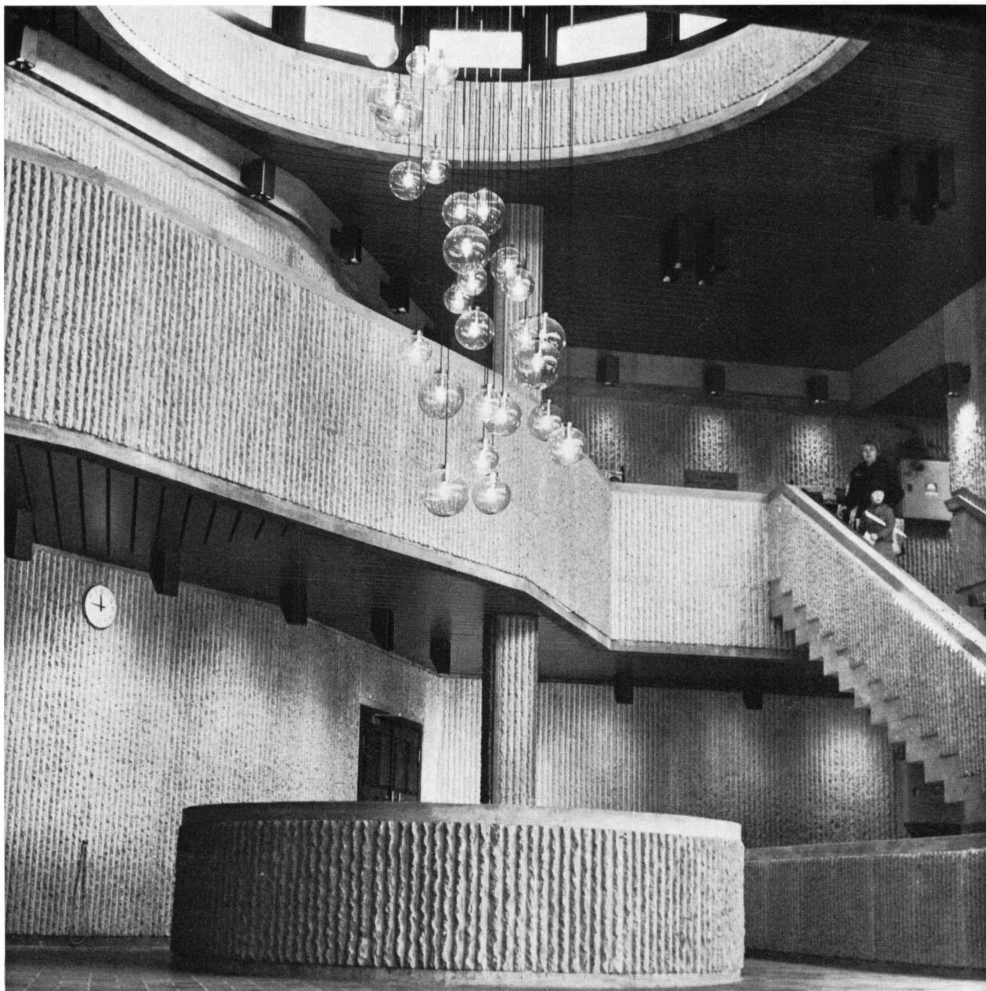
Rathaus in ONSØY, Norwegen, Struktur «Allegrone», 1500 m 2

wünscht Ihnen mit strukturiertem Sichtbeton noch grösseren Erfolg!