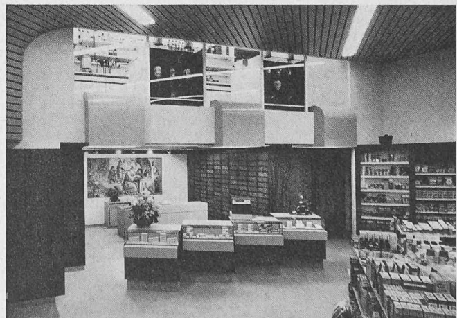
Beispiel eines ausgeführten Ladenbaus