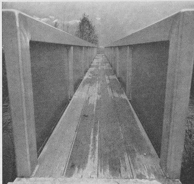
Aluminium-Bodenplatten für Fussgängersteg