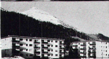
Überbauung Rietstrasse, Elektrizitätswerk der Landschaft Davos; total 33 Wohnungen; Anschlusswert ca. 400 kW

Star Unity AG Fabrik elektrischer Apparate Zürich, in Au/ZH Tel. 01 75 04 04