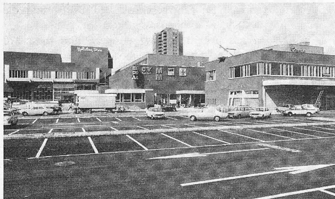
Das Zentrum mit Einfahrt am Ostring, links das Hallenbad (Eingang) und der Hotelsaalkomplex