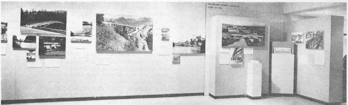
Ausstellung im Museum of Art, Princeton, Ausschnitt

Am ersten Abend war Empfang und Nachessen im Hotel, wo Gelegenheit gegeben wurde, Bekanntschaft zu machen. Die Organisatoren waren wie auf Nadeln, da Prof. Max Bill , der am selben Abend im McCormick Hall einen öffentlichen Vortrag halten sollte, erst in letzter Minute ein-