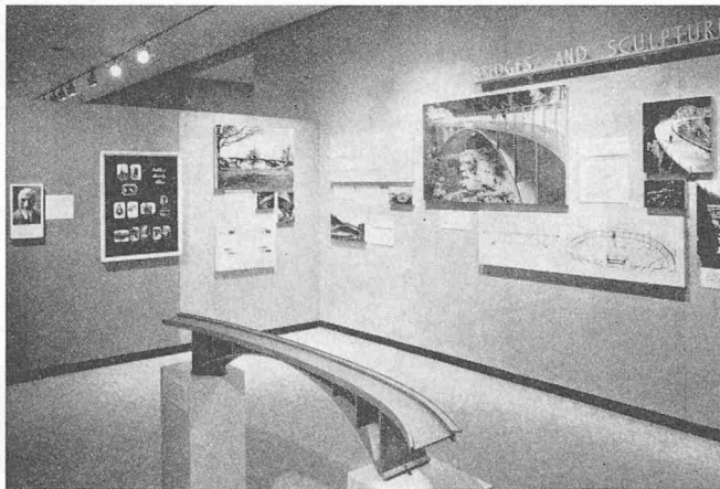
Ausstellung im Museum of Art, Princeton, Ausschnitt