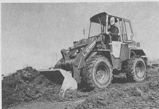
O & K - Pneulader L 6