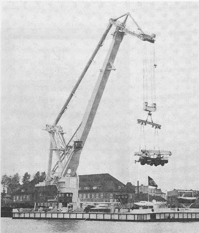
Bild 1. Der neue Krupp-Schwimmkran im Hafen von Wilhelmshaven vor dem Schlepptransport nach Brasilien

men. Die Drehverbindung besteht aus einer konischen Stützsäule, und die oberen Horizontalkräfte werden durch ein Axialpendelrollenlager auf die Stützsäule übertragen, die horizontalen Gegenkräfte über das Pontondeck eingeleitet. Im Ponton mit einer Seitenhöhe von 3,8 m sind die Maschinenanlagen und die Unterkünfte für die 15köpfige Besatzung untergebracht. Durch Verstärkungen und Holzbalken kann der hintere Teil des Pontondecks maximal 200 t Decklast aufnehmen. Je ein durchgehendes wasserdichtes Längsschott (Wallgang) auf Backbord- und Steuerbordseite bietet zusätzliche Sicherheit gegen Beschädigen der Aussenhaut durch Kollision.