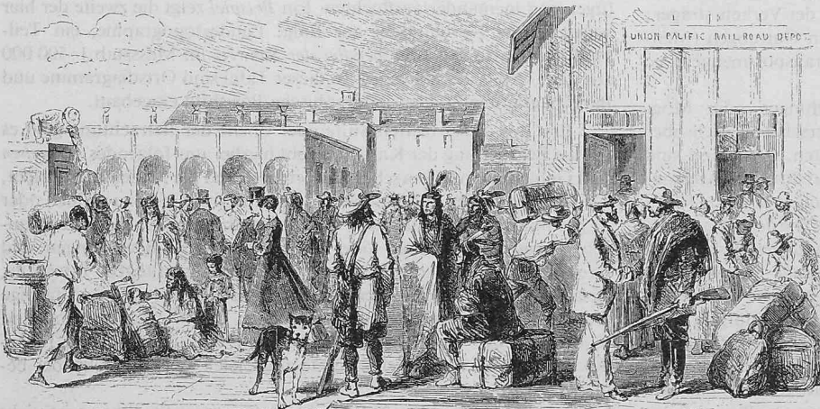
Bild 1. Station Omaha. Noch war das Zeitalter der Indianerkriege, und viele Leute hatten ihr Schiessisen stets bei sich

Für unsere engen Verhältnisse kaum verständlich ist, dass an der Spitze der Kolonne Jäger und Geometer den Lauf des künftigen Schienenweges erforschten, während weiter zurück die Arbeiterheere den Unterbau schufen und noch weiter hinten bereits regelmässige Züge rollten. Wie in England die «Navvies» — vom Kanalbau zum Eisenbahnbau herangezogene irische Arbeiterscharen —, so waren es auch bei der Union Pacific vorwiegend Irländer, denen die schwere und mitunter gefahrvolle Handarbeit zufiel. Wo die Eisenbahn ein Ausweichgleis oder eine Wasserzapfstelle brauchte, entstand schon die nächste Ortschaft auf dem Wege nach Westen. Deren Namen beweisen oft genug ihren Ursprung: «Locomotive Springs», «Carbon» oder einfach «400 Miles» (Bilder 1 bis 3).