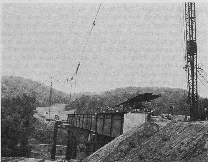
Bild 1. Ansicht der Baustelle während des Ausrichtens eines Brückenträgers mittels Seilbahn und neigbaren Türmen