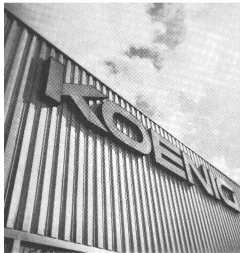
für Fassaden und Bedachungen