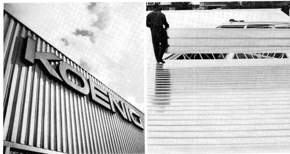
für Fassaden und Bedachungen