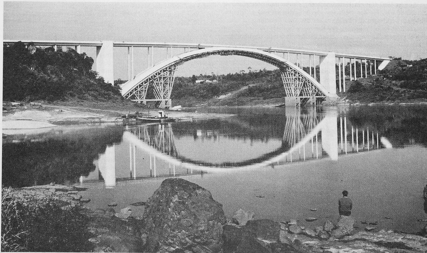
Ansicht der Brücke bei Niederwasser. Bei Hochwasser standen die untersten horizontalen Streben des Fächers des Lehrgerüst-Bogens in den Fluten des Rio Paraná