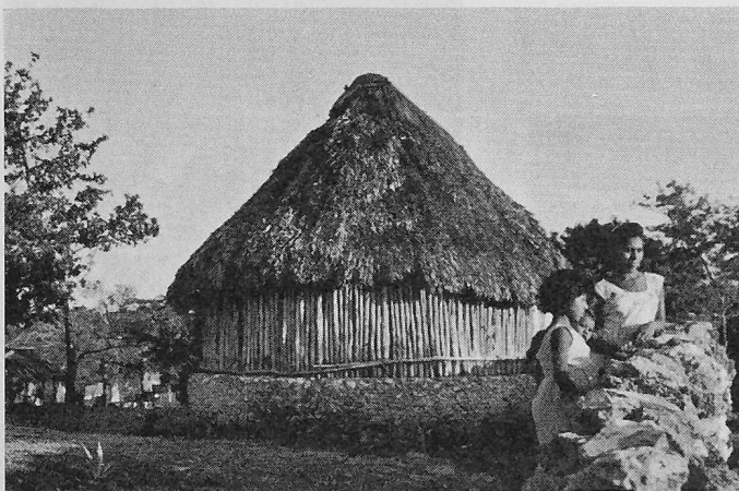
Wohnstätte der Eingeborenen in Mexico

Umgebung und das Meer bietet. Wir waren des eingeschalteten Ruhetages recht froh und trennten uns nur ungen von Acapulco. Abends landeten wir bereits wieder in Mexico-City.