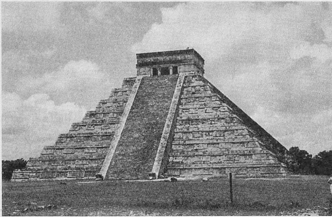
El Castillo, Mexico