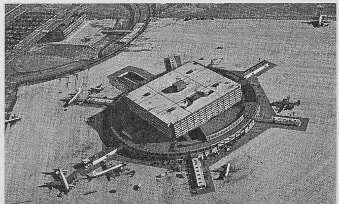
Flughafengebäude in Toronto, Kanada

Infolge des Holzreichtums der Rocky Mountains hat sich in Vancouver eine grosse Holzverwertungsindustrie entwickelt, die längs des Fraser-Flusses (Flösserei) gelegen ist. Der Besuch einer Sperrholzversuchsanlage, in welcher Untersuchungen für die zweckmässige Verwendung des reich-