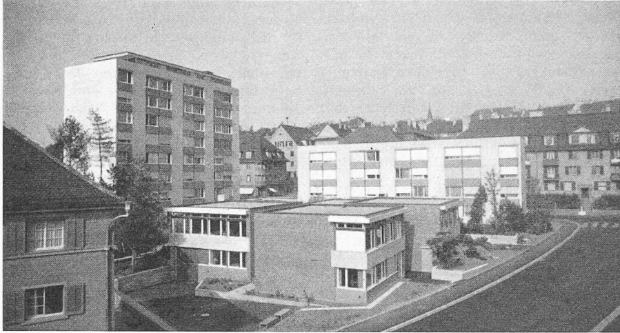
Bild 1. Alterssiedlung Letten in Zürich-Wipkingen. Die beiden Trakte (zu 8 und 4 Wohngeschossen) bilden einen sich gegen Süden öffnenden Winkel. Im Vordergrund (Mitte) befindet sich ein Kindergartengebäude, das sich in den architektonischen Rahmen der Anlage fügt

Hans Marti & Hans Kast, Architekten S.I.A., Zürich, Fietz & Hauri, Bauingenieure S.I.A., Mitarbeiter E. Hofmann, Ing. S.I.A., Zürich