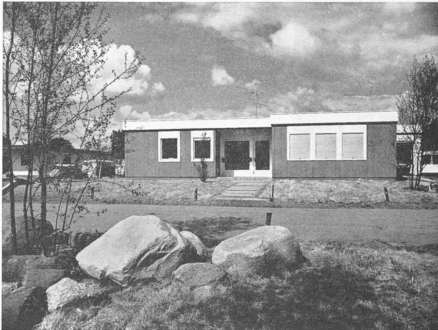
Haus 26. Stratmann-Fertighaus, Typ «Münsterland I». 5 Zimmer, 126 m 2 Wohnfläche, 660 m 2 Grundstück. Preis ab Oberkante Keller 72 410 Mark; Gesamtpreis 125 520 Mark. Bauelemente aus Holzspanplatten, Holzverblendung; vorgefertigte Installationsblocks; Montagedauer drei Wochen. Auswahl unter neun Grundtypen zwischen 64 und 140 m 2 Wohnfläche.