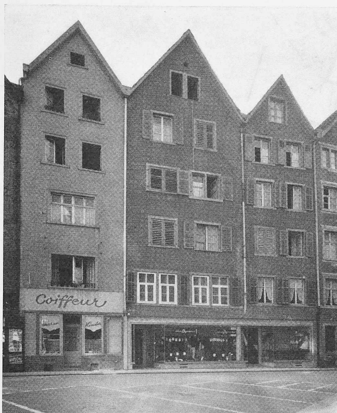
Partie aus der Oberen Gasse beim Gansplatz (Zone A 2)

Die Entschädigungspflicht richtet sich nach Art. 16 der kantonalen Verordnung über Natur- und Heimatschutz.