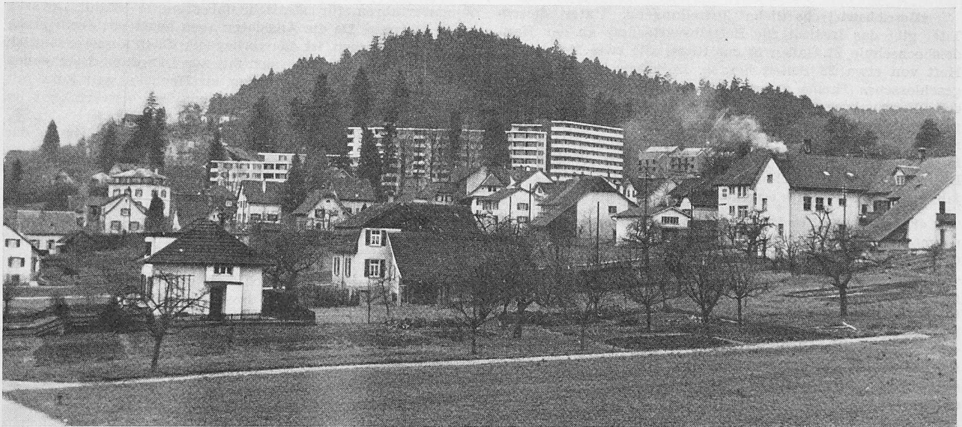
Ansicht des Tannengutes aus Nordosten