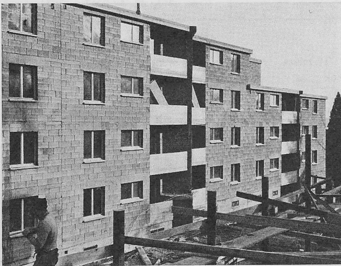
Block A im Bau aus Norden gesehen

Die Ausführung hält sich im wesentlichen an den Ueberbauungsplan. Zwei Blöcke (vier- bzw. fünfgeschossig) stehen