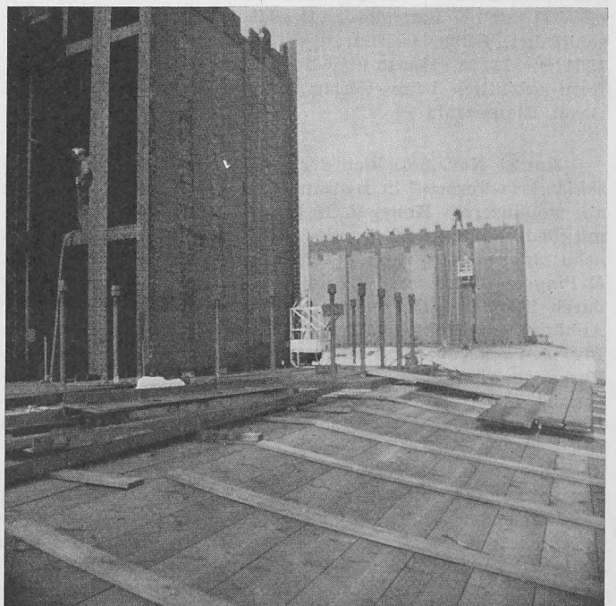
Bild 4. Pylon Seite Staten Island