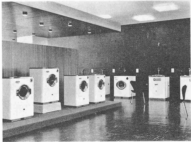
Der Vorführraum der Verzinkerei Zug AG

Auch von innen zeigt sich die Konstruktion ohne Verkleidung. Keine Vorhänge, keine Sims Bretter; die Radiatoren sind ohne Verkleidung vor die Fenster gestellt. Die stark gegliederten Decken- und Wandflächen wurden weiss durchgestrichen und wirken zurückhaltend und ruhig. Alle Beleuchtungskörper sind ebenfalls weiss. Nur in der Vor-