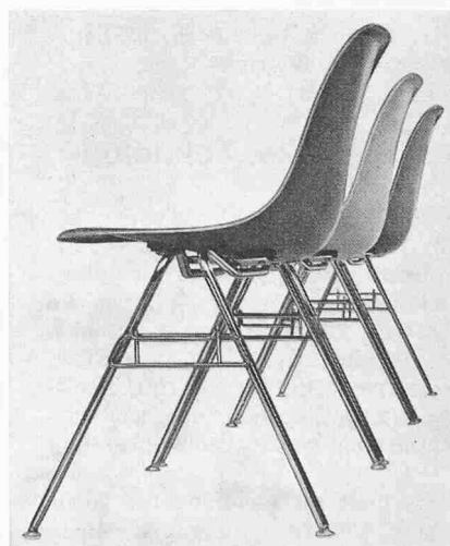
D S S —