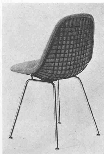
D X 1