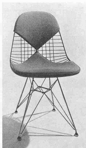
D K R 2