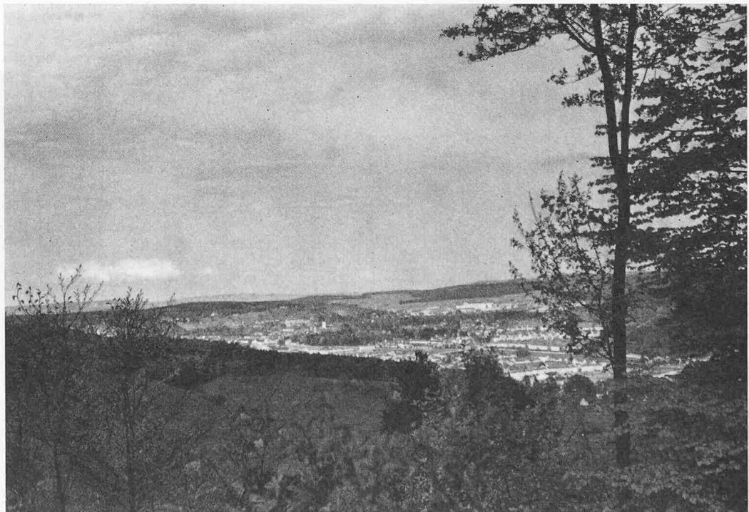
Wie keine andere Schweizer Stadt ist Winterthur in prachtvolle Wälder eingebettet. Blick aus West/Südwest auf die Stadt: rechts im Vordergrund Töss, darüber das Oberwinterthurer Industriegebiet, links der Bildmitte die Altstadt.

Die Waldungen unserer Gegend waren ursprünglich vorwiegend gemischte Laubholzwaldungen. Man trachtete aber schon früh nach Vermehrung des wertvolleren Nadelholzes. Der schöne Plan des Eschenbergs, erstellt 1756 durch das Artillerie-Collegium, weist schon grosse Flächen von reinen Nadelholzbeständen auf. Das waldbauliche Vorgehen war damals schirmschlagähnlich. Die haubaren Bestände wurden erst aufgelockert, nachher bis auf einzelne Ueberständer ab-