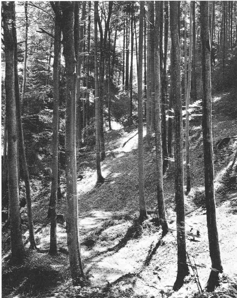
Zum Aufsatz von K. Madliger: links Bilder aus dem Eschenbergwald, unten rechts Spazierweg im Lindberg

Herkunft der Bilder: Tafeln 29 bis 31 oben Stadtbibliothek Winterthur, Tafel 31 unten Photo Swissair, Tafel 32 links Photos Madliger, unten rechts Photo Engler, Winterthur