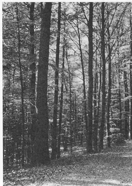
Links Kahlschlag mit einzelnen Föhren-Ueberständern, Bild aus dem Jahre 1895, rechts die gleiche Gegend im Jahre 1960. Der vorderste Baum auf dem Bilde links ist identisch mit dem kräftigsten auf dem Bilde rechts