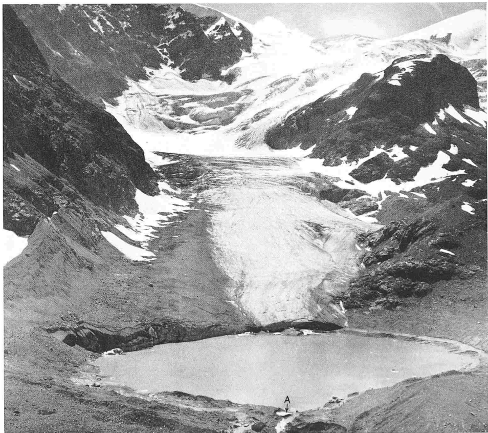
Bild 20 (rechts). Steingletschersee nach dem Ausbruch vom 29./30. Juli 1956. Aufnahme KWO vom 31. Aug. 1956. Man beachte die starke Schuttbedeckung der orographisch rechten Gletscherhälfte, welche die Erhaltung von Toteis ermöglicht. Am Seeausfluss erkennt man eine durch die Seabsenkung entblösste Toteislinse (A)