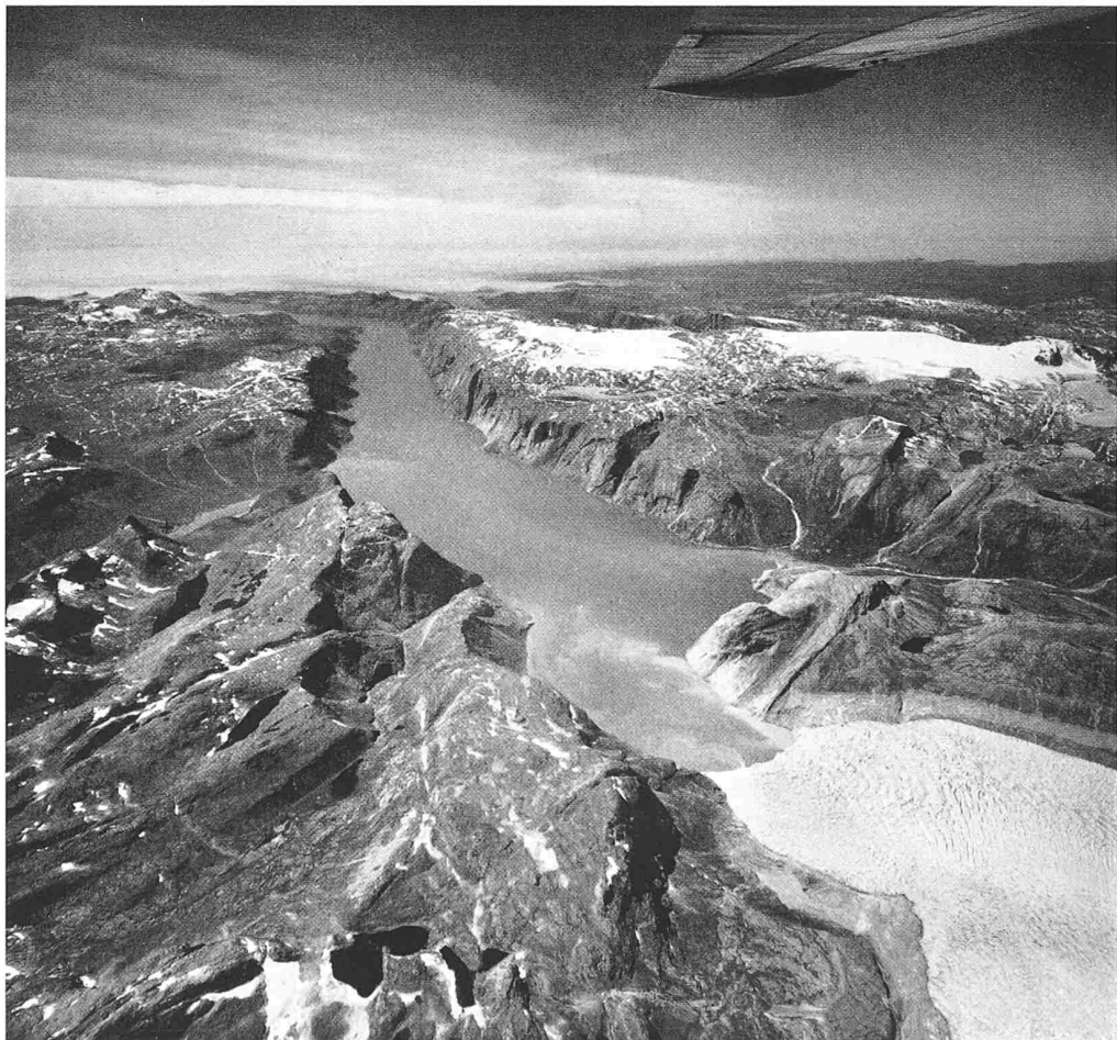
Bild 19. Grönland. Blick vom Innern eines eisfreien Fjordes gegen das Meer, über dem sich eine Nebeldecke ausbreitet. Geodätisches Institut Dänemark, Aufnahme 17. Juli 1948. Alle Rechte vorbehalten. — Man beachte die steilen Flanken des Gletschertroges, ferner den hellen unverwitterten Geländestreifen über dem ausfliessenden Gletscher am rechten Bildrand, der ähnlich wie bei den alpinen Gletschern (Stand etwa 1850) einen früheren höheren Eisstand markiert