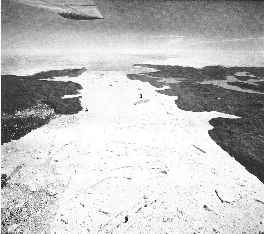
Bild 18. Westgrönland, Jakobs-havn. Isfjord. — Blick gegen das Inlandeis. Totale Länge des eisbedeckten Fjords rd. 35 km. Fjordbreite bei A rd. 7 km. Die starke Eisbedeckung des Fjordes (Verstopfung) ist, abgesehen von der enormen Aktivität des kalbenden Gletschers (am Rinkgletscher wurden Fliessgeschwindigkeiten bis 27 m/Tag gemessen) durch die seeseitige Grundschwelle bedingt, welche die Eisberge erst ins offene Meer entlässt, wenn ihr Tiefgang infolge Ablation geringer geworden ist. Die Länge des bei B sichtbaren Eisberges beträgt rd. 1,5 km, seine grösste Höhe (incl. Tiefgang) schätzungsweise 600 bis 800 m. Man erkennt, dass der Eisstrom weit aus dem Inneren des Inlandeises herausfließt