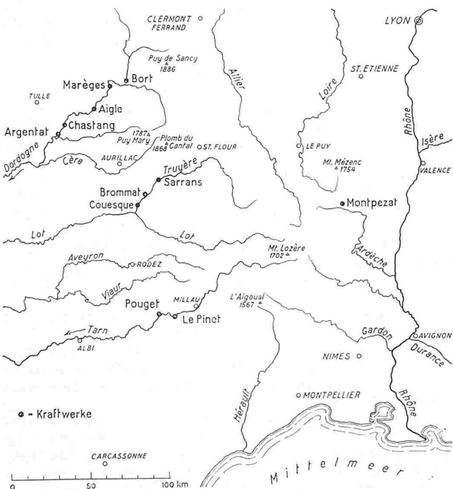
Bild 53. Uebersichtskarte des Massif Central mit Eintragung der beschriebenen Kraftwerke

Der ganze Steilabfall gegen Südosten, bis dort, wo die Urgesteine unter die Kalke der Ebene zwischen Aubenas und Les Vans untertauchen, war auch Eruptionsgebiet. Lavaströme ergossen sich über die Hänge und bildeten mächtige Decken. Eine solche zwischen Vals und Montpezat ist 500 m dick; prächtige schwarze Basaltsäulen säumen wie Orgelpfeifen streckenweise Strasse und Fluss und man zeigt «pavés de géants», die Oberflächen solcher in prismatischen Säulen erstarrter Basaltdecken.