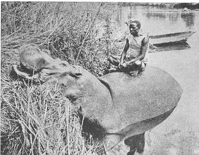
Bild 7. Das erlegte Nilpferd

Oberfläche treiben. Diesmal verlief alles glatt, und nun gab es ein Fest im Dorf, denn das Fleisch — für mich ungeniessbar — ist für den Neger der herrlichste Leckerbissen. Es wurde gesungen und getanzt, und eine Jungfrau erschien mit einem Riesentopf Pombe, dem Negerbier, das der Jumbe schon präpariert hatte, als der Tom-tom mitteilte, dass ich im Kommen sei (Bild 8).