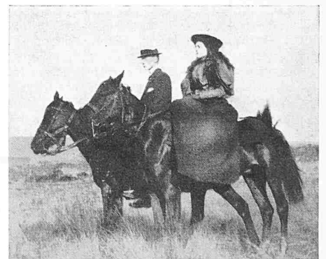
Bild 4. Sein Besitztum war so gross, dass man 1½ Stunden zu Pferd brauchte bis zum Nachbarn