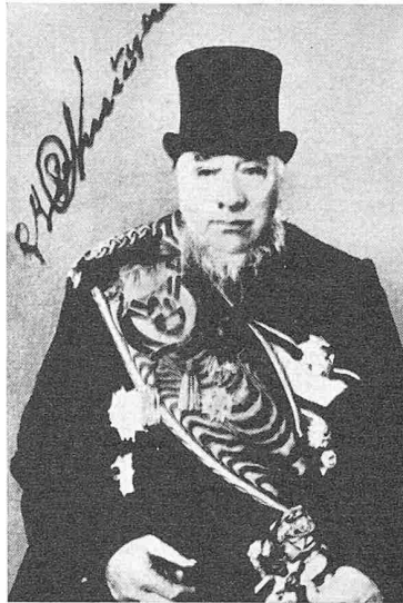
Bild 1. Ohm Paul Krüger