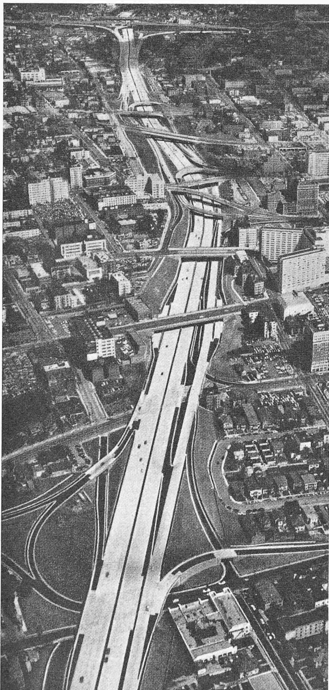
Der Downtown-Abschnitt der neuen Ausfallstrasse von Los Angeles