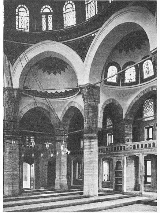
Rechts: Aus der Moschee in Azap Kapu