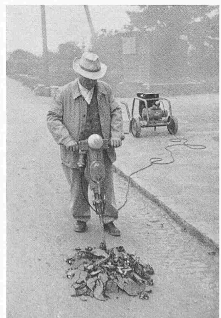
Bilder 2 und 3. Beim Bau von Lawinerverbauungen