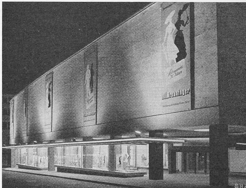
Bild 19. Erdgeschoss fertig, Obergeschosse provisorisch verkleidet