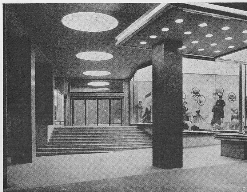
Bild 21. Nördliche Eingangspartie