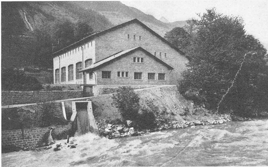
Bild 9. Aletschwerk, Maschinenhaus von der Rhone aus gesehen

Bau einer besonderen Anstalt für Verwahrungsgefangene kommt nicht in Frage. Wohl oder übel muss man sich der Notwendigkeit beugen. Aber daran kann kein Zweifel bestehen: eines der wichtigsten Ziele der modernen Strafvollstreckung wird damit schwer gefährdet, wenn nicht völlig vereitelt. Um so grössere Bedeutung kommt naturgemäss jedem Neubau zu, der im Einzelfall gestattet, den Gedanken des Gesetzgebers zu verwirklichen und dann, vielleicht weiterwirkend, zur Nachahmung auffordert.