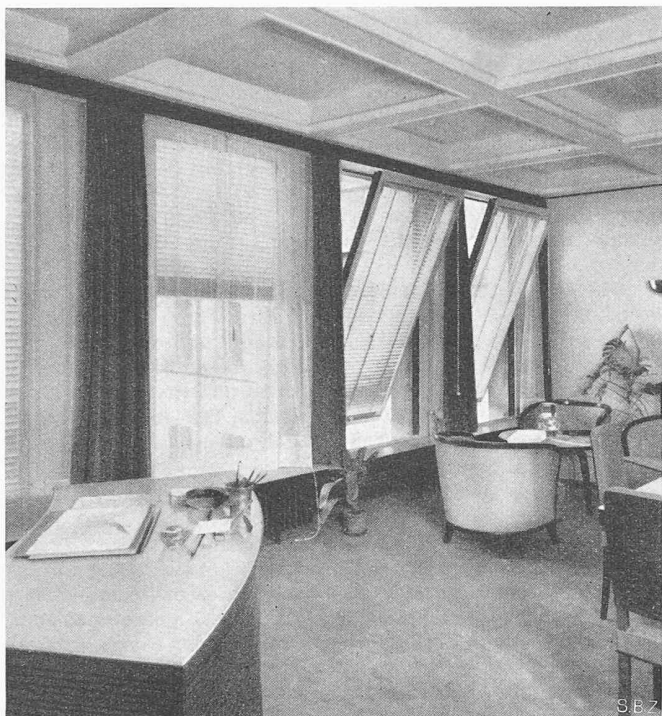
Bild 2. Carda-Fenster mit tiefer Brüstung