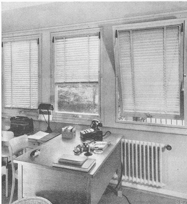
Bild 3. Carda-Fenster normaler Grösse

meinen wird es aber genügen, je nach der Sachlage, sich auf die eine oder andere Art der Bestimmung zu beschränken.