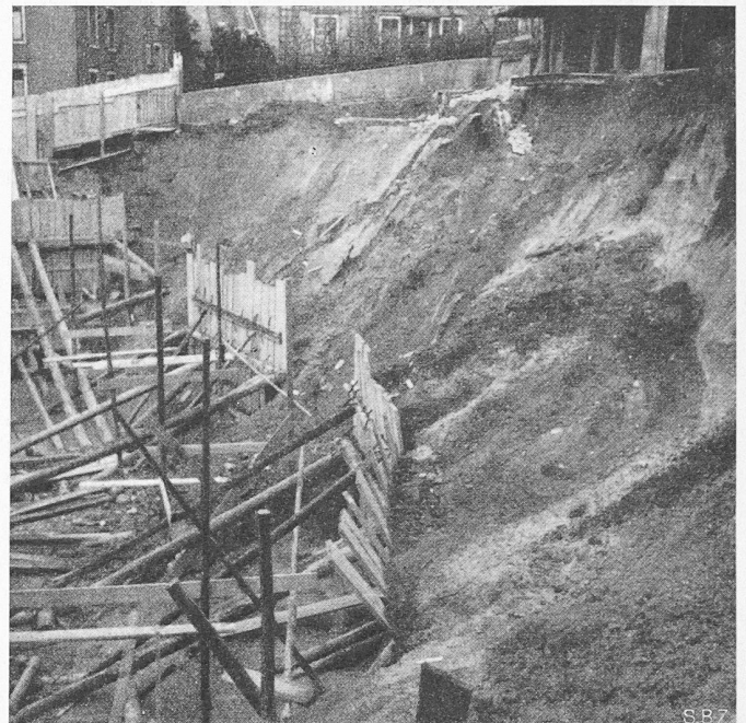
Bild 2. Zustand der Baugrube am 10. Januar 1948

Die Wiederherstellung der Strassenbrücken an den anderen Hauptverkehrslinien wurde in zwei Stufen ausgeführt: zuerst ein hölzernes Provisorium, dann die endgültige Konstruktion. Für die kleineren Spannweiten hat man die gesprengten Teile gehoben und ergänzt. Für die grösseren Spannweiten von 20 bis 30 m wurden Typenbrücken entwickelt, die einen geringen Stahlaufwand benötigten: leichte geschweisste Stahlelemente zu Fachwerkträgern zusammengeschrabt, Fahrbahn aus Holz. Verbundkonstruktionen wurden sehr viel angewendet, da sie eine rasche und leichte Ausführung erlaubten. Trotz des 50—60 % höheren Stahlaufwandes im Vergleich mit Eisenbetonbalkenbrücken von 20 bis 30 m Spannweite blieben sie wirtschaftlicher (erklärlich durch die Wiederverwendung der gesprengten Teile in der Verbundbauweise). Für Spannweiten über 30 m wurden Bogenbrücken mit Zugband angewendet. Die Zalaidvég-Brücke erhält einen vollständig geschweissten Stahlbogen von 42,08 m Spannweite ( f/1 = 1/5,2 ) und eine Fahrbahnplatte aus Eisenbeton von