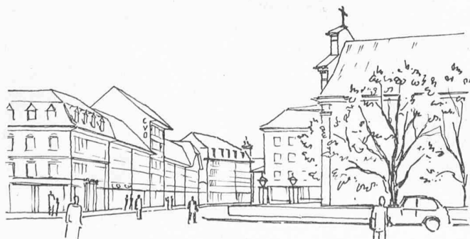
Der Kirchplatz nach Erstellung des geplanten Neubaus: der Rhythmus ist zerstört