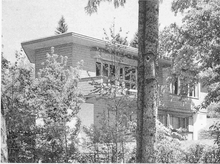
Abb. 6. Gesamtbild aus Süden