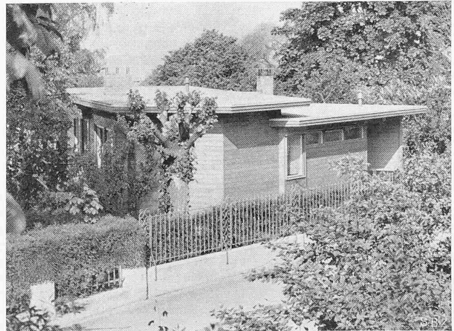
Abb. 9. Gesamtansicht aus Osten