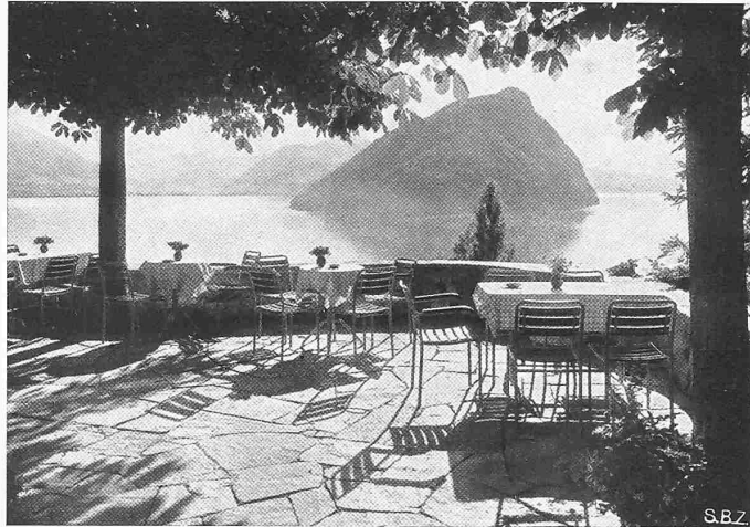
Abb. 2. Blick vom Hügel vor der grossen Aussichtsterrasse des Ferienheims gegen den Bürgenstock

Ein architektonisch gutes Beispiel ist sicherlich die Gliederung , die den Rahmen der üblichen Hotelbauweise sprengt und die