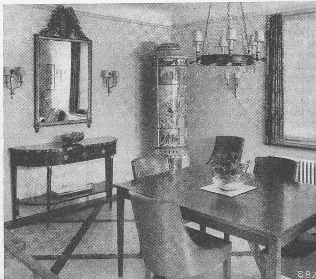
Abb. 10. Ofenecke des Esszimmers.