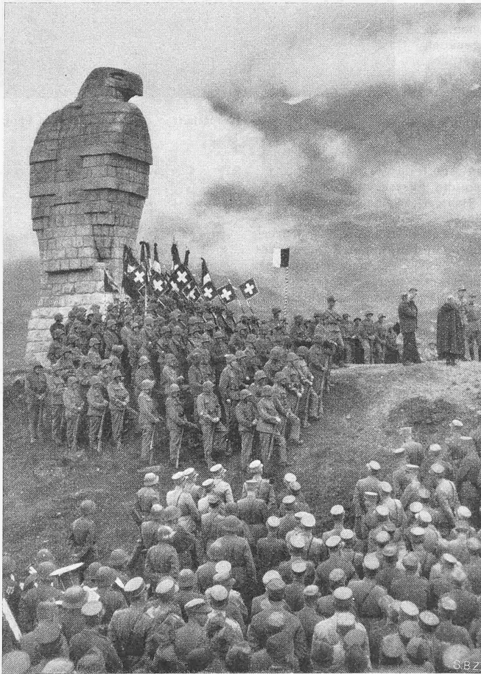
Abb. 1. Die Einweihungsfeier

Noch eine weitere Schwierigkeit bot die Herstellung dieser genauen Matrize. Formt nämlich der Bildhauer eine übliche Stückform, so passt er Stück um Stück der Oberfläche des Originals an, um es widerstandslos wieder entfernen zu können. In unserm Fall jedoch gab es kein Aussuchen. Jede Schicht musste genau dem horizontalen Verlauf der Fuge im geplanten Mauerwerk folgen. Dies bedingte gelegentlich ungemein zeitraubende Kleinarbeit an Keilen und Keilchen, um das Festsitzen der Stücke zu verhindern. Zudem musste jede Schicht an ihrer äusseren Kante genau das Schnurgerüst einhalten. Ferner musste die Matrize nach dem Ausbau des Gipsoriginals in gestürzter Stellung ohne Haube im Schnurgerüst stabil bleiben. All diesen