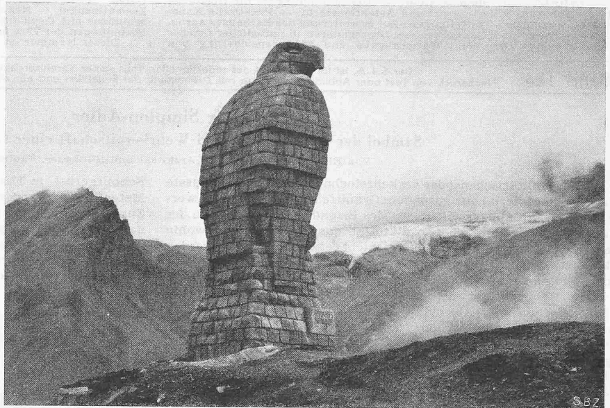
Abb. 2. Der Adler in der Landschaft

Der Bruchstein-Koloss mitten in der Urweltlandschaft des Hochgebirges ist nicht nur Mahnung zu steter Wachsamkeit und Wehrbereitschaft, nicht nur Erinnerungsmal an dunkelste Kriegszeit, sondern ebenso sehr auch der erfreuliche Ausdruck für ein in gemeinsamer Tat vollbrachtes Werk.