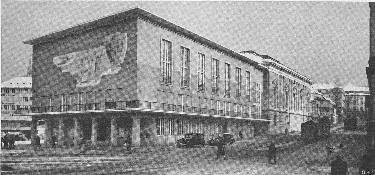
Abb. 4. Neubau Casino (mit Pellegrini-Fresco). Architekten W. KEHLSTADT, W. BRODTBECK, BRÄUNING, LEU, DÜRIG. Rechts Musiksaal

dem Werk aber den innigen Zusammenschluss mit dem Bau und den Charakter einer notwendigen Ergänzung sichert. Pellegrini hat die mit dem ehrenen Auftrag übernommene Verpflichtung sehr ernst genommen und das Seinige geleistet, um das Bild bis zu einer der architektonischen Form innerlich verwandten Komposition zu verdichten» . . .