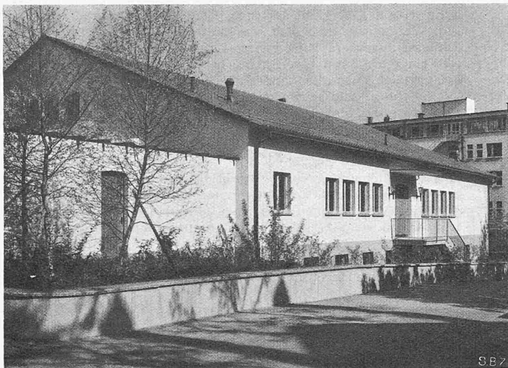
Abb. 2. Ostfront am Friedheimweg des Wohlfahrtshauses der Dr. A. Wander A. G., Bern