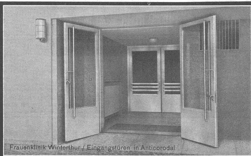
Frauenklinik Winterthur / Eingangstüren in Anticorodal

GEILINGER & CO. Eisenbau-Werkstätten WINTERTHUR