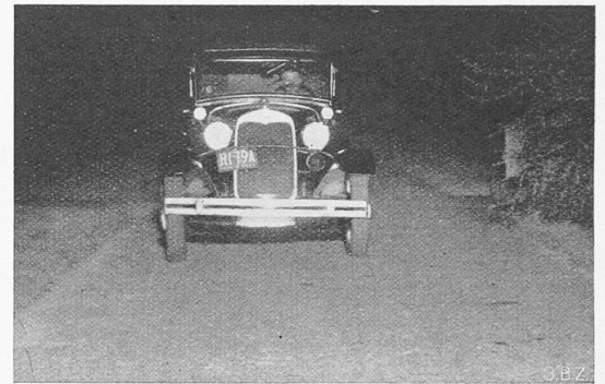
Abb. 2. Vermeidung der Blendwirkung bei vollem Polaroid-Scheinwerferlicht, Aufnahme durch Polaroidfenster

trums zu sinkt sie langsam, gegen das rote Ende hin sehr schnell ab. Die Zone vollkommener Polarisation liegt also glücklicherweise vollkommen im sichtbaren Spektrum, das sie fast ganz ausfüllt. Wenn man eine hellbeleuchtete Landschaft durch zwei gekreuzte Polaroidfilme betrachtet, sieht man sie im tiefsten Rotviolett, da nur die Lichtstrahlen von beiden Enden des Spektrums teilweise durchdringen. Ein idealer Polarisator würde 50% des auffallenden Lichtes durchlassen; durch die unvermeidlichen Reflexionsverluste an beiden Oberflächen wird dieser höchste mögliche Wirkungsgrad auf 46% hinabgedrückt. Polaroid ergibt im Durchschnitt 37%.