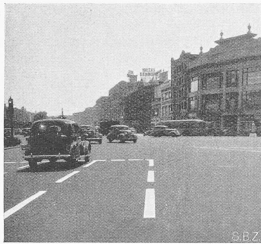
Abb. 1. Sonniges Platzbild, links ohne, rechts mit Polaroidvorsatz photographiert Gleichzeitige Parallelaufnahmen mit gleicher Belichtungszeit