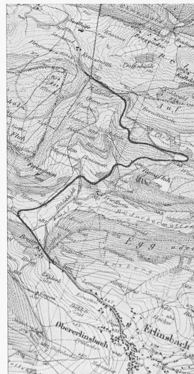
Die Saalhöfe-Strasse Aarau-Baselland