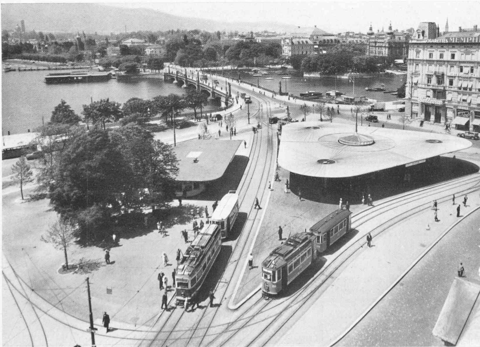
Abb. 2. Gesamtbild des Bellevueplatzes aus Osten (Abb. 2 und 5 bis 12 Phot. Wolgensinger, Zürich)

Auf der Dreiecksinsel, als der eigentlichen Verkehrsinsel unter einem grossen Schutzdach, liegt der Warteraum mit Zugang von der Linie Bahnhof-Seefeld als wichtigster Linie in diesem Ver-